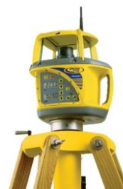
Sklonový rotační laser